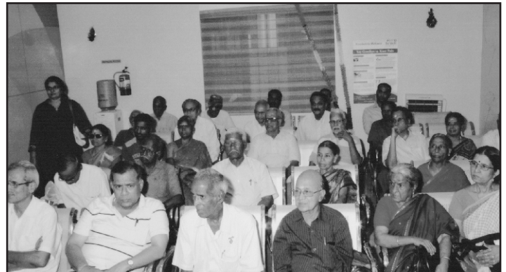
A section of the audience